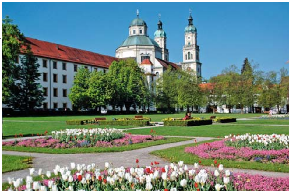
Hofgarten, St. Lorenzbasilika und die Kemptener Residenz bilden eine stimmungsvolle Bühne für die „Fürstensaal Classix“.